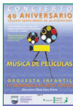
Cartel del concierto celebracion del 40 aniversario.

El concierto está organizado por la Fundación AFA-NIC, dedicada a ayudar a niños enfermos. Las entradas para este concierto benéfico se pondrán a la venta en Servicaixa o en el teléfono: 902 33 22 11.