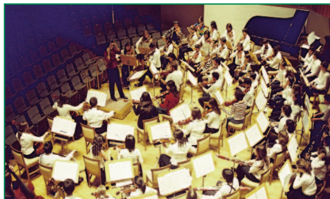
La FMJ durante uno de los ensayos en el Auditorio Nacional.