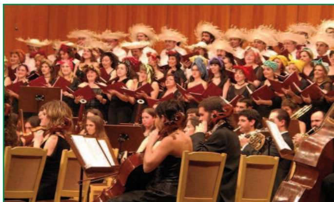
El Coro Talía y la OSC durante el concierto que ofrecieron en el año 2006 en el Teatro Monumental.

El concierto continuará con el estreno absoluto de la "Cantata del agua" de Alejandro Vivas, una composición