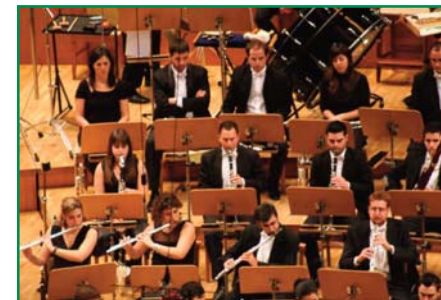
Sección de viento de la OSC.

Con la interpretación de una suite con piezas de las películas de Harry Potter, virtuosas piezas llenas de contrastes y con una brillante orquestación, se llegó al descanso dejando para la segunda parte varias obras que llegaron al público. Desde la música que Harry Gregson-Williams pusiera a la película “Shrek” y la banda sonora de “El libro de la Selva” la segunda