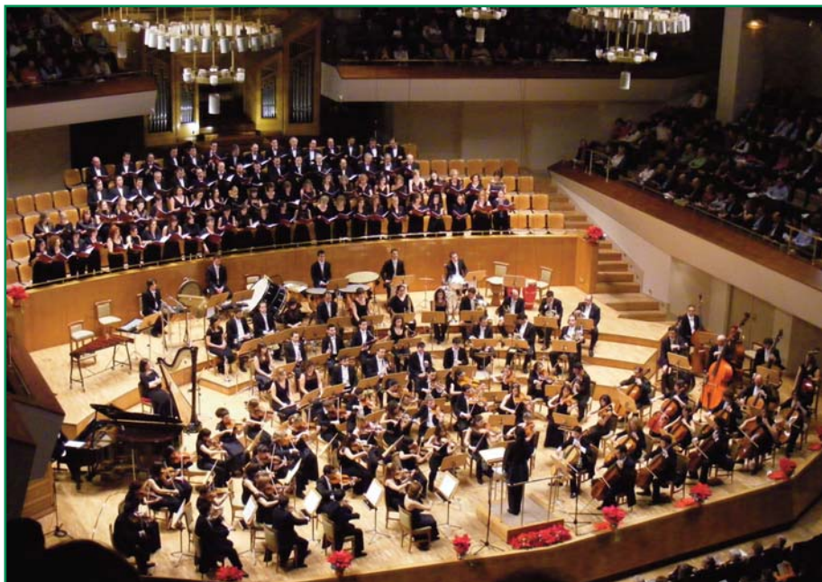
La OSC y el Coro Talía durante el Concierto de Navidad en la sala sinfónica.

la fanfarria de la 20th Fox que precedió a un título cumbre en la carrera de John Williams, la mítica banda sonora de Superman. Con gran brillantez y destacando a la sección de viento metal que tuvo gran trabajo durante todo el concierto y una gran capacidad musical, ya que rayaron a gran nivel en todas las obras.