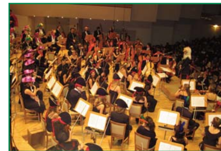
La OSC durante la interpretación de “Chicken Run”.

Continuó el concierto con la música de Hans Zimmer de Gladiator, y finalizó el programa con una suite de piezas del gran John Williams pertenecientes a las diferentes entregas de la Guerra de las Galaxias, que no fué lo último. Todavía quedaban un par de sorpresas, en forma de banda sonora de la película de animación “Chicken Run” de Harry Gregson-Williams y como final de fiesta, incluso con la orquesta y el coro disfrazados ad-hoc, la música de “Piratas del Caribe” de Klaus Badelt como colofón a este gran concierto, digno del mismo Hollywood.