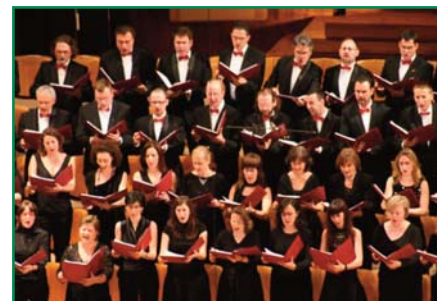
Varios de los componentes del Coro Talía.

La música del compositor español, Alejandro Vivas, gustó mucho por su intensidad y buena composición, otorgando un gran papel al coro, que sobresalió en todos los números en los que participaba. Siguió la primera parte con la obra de Steiner, “Lo que el viento se llevó”, que probablemente arrancara alguna lágrima al público asistente, con una cálida interpretación llena de fuerza y pasión.