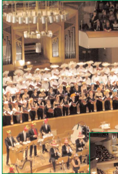
Concierto "Aires Latinos" en el Auditorio Nacional.

Se trata, sin duda, de una apuesta novedosa y llena de encanto para un concierto de Navidad. En este particular viaje hemos disfrutado del ritmo frenético de la percusión caribeña, del arrullo embrujador del acordeón en un tango a ritmo de bolero y de la sensualidad de la Bossa Nova, para terminar con una sobrecogedora versión del