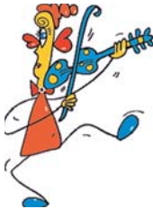
Ilustración: Carlos Baonza

turada en forma de fuga escolástica. Sus casas tienen forma de instrumentos, andan bailando y poseen distintos tipos de respiración coincidentes con diferentes ritmos. Viven en una isla móvil ("Keke") que viaja a través de los mares gracias a la energía que le proporciona un geiser que se activa con la música.