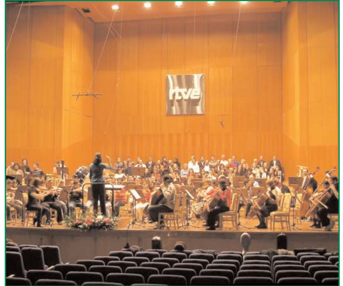
La Orquesta Sinfónica Chamartín y el Coro Talía durante el ensayo.

Durante el concierto se pudieron escuchar obras de origen sudamericano entre las que destacaron "Huapango" de J. Pablo Moncayo, "Piazzolina" del compositor español A. Vivas y "El día que me quieras" de Carlos Gardel. Para finalizar el concierto la orquesta y el coro ofrecieron varias "propinas" entre las que se incluyó el espiritual "Joshua fought the battle of Jerico". El presidente