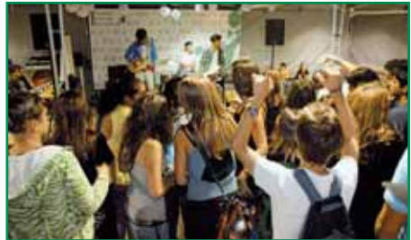
Carpa de la FOSC Fiestas de San Miguel 2009. Grupo Sexy Zebras .