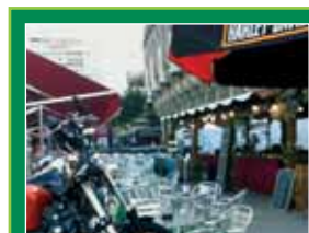
HARLEY DAVIDSON CAPITAL Agustín de Foxá 27. Madrid

una cita con múltiples atractivos. Y si Prosperidad será el centro de la fiesta de la moda, la explanada del Bernabéu se convertirá en una fiesta motera, ya que albergará del 13 al 18 de septiembre la Feria Harley Davidson Capital , un encuentro con entrada gratuita que será una cita obligada para aficionados a las dos ruedas y para todos aquéllos que quieran conocer un poco más las virtudes de esta destacada marca en el ámbito del motor.